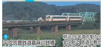
9 平成築業鉄道嘉麻川鉄橋 あかぢ駅から500m