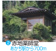
5 赤地薬師堂 あかぢ駅から700m

あかぢ駅ぶらぶらコース 約2時間30分 ●あかぢ駅～塙石～大祖神社～旧長崎街道（赤地天満宮・店屋の渡し跡など）～遠賀川河川敷サイクリング道路～嘉麻川鉄橋（明治26年製）～あかぢ駅（新橋を経由して南直方御殿口駅に行けます）