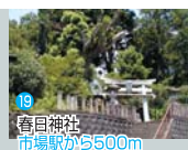
19 春日神社 市場駅から500m