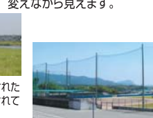
22 福智町運動公園 ふれあい生力駅から200m 自然の芝で、広い球場等各施設が集まって、町民の運動公園になっています。

ふれあい生力駅散歩コース ●開発された地区だと一目でわかる新しい街です。駅からスロープを上上がると運動公園がすぐそばです。