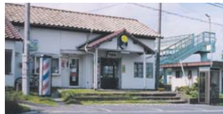
中泉駅（理髪店があります）