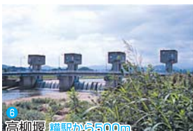
6 高柳堰 糶駅から500m

彦山川の清流が季節の風を運んできます。川土手をぶらぶら歩いてくと下伊田駅まで約30分です。