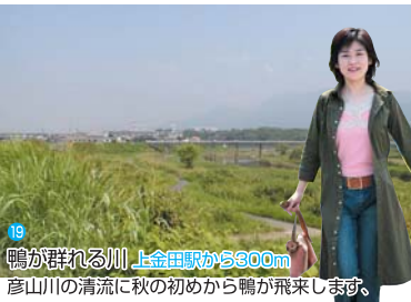
18 鴨が群れる川 上金田駅から600m

●高柳堰へ約300m、気持ちのいい川風を運んでくれます。田川市立病院駅～田川市立病院間は連絡バスがあります。