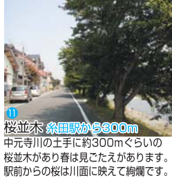
11 桜並木 糸田駅から600m

中元寺川の土手に約300mぐらいの桜並木があり春は見ごたえがあります。駅前からの桜は川面に映えて綺麗です。