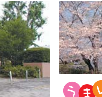
26 川渡り神幸祭の舞台