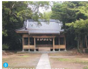
8 王莖八幡神社 (宝山城址) 美夜古泉駅から約1.5km 中世城館跡で馬ヶ岳城の山城と伝わる。