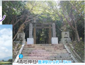
2 清地神社 豊津駅から約1.5km

大宰府と国府を結ぶ長大な古代道路で、清地はかっぱ神社の石段の右手にある堤(大地)の中を横切って、豊津駅ホーム(行橋方)の端から100mぐらいの地点を結ぶ線为国府まで通じていました。その中でも広く、30mとも100mとも言われています。また、大谷の交差点から馬ヶ岳登山口、登山道を行くと丘陵に道路の切り通しと道路跡が残る所があるそうです。