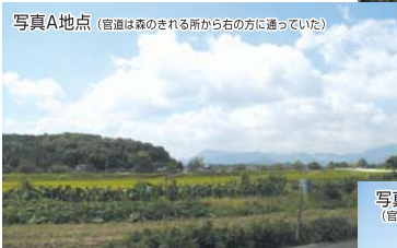
写真A地点 (官道は森のきれの所から右の方に通っていた)

大宰府と国府を結ぶ長大な古代道路で、清地はかっぱ神社の石段の右手にある堤(大地)の中を横切って、豊津駅ホーム(行橋方)の端から100mぐらいの地点を結ぶ線为国府まで通じていました。その中でも広く、30mとも100mとも言われています。また、大谷の交差点から馬ヶ岳登山口、登山道を行くと丘陵に道路の切り通しと道路跡が残る所があるそうです。