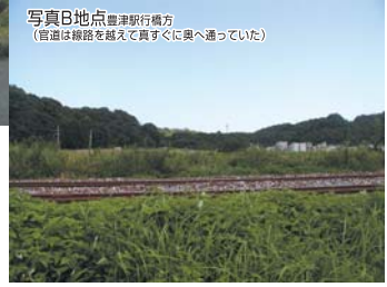
写真B地点 豊津駅行橋方 (官道は線路を越えて真すぐに奥へ通っていた)