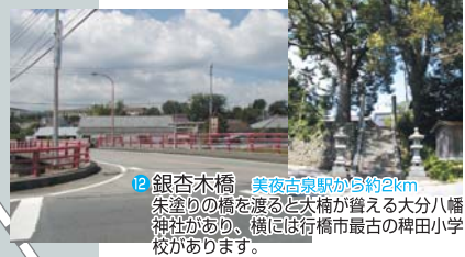
12 銀杏木橋 美夜古泉駅から約2km 朱塗りの橋を渡ると大橋が見える大分八幡神社があり、横には行橋市最古の稗田小学校があります。