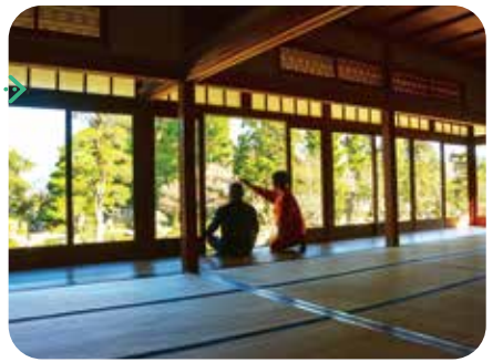
※画像は全てイメージ/Hです。

明治から昭和初期まで筑豊を中心に炭坑を経営し、全国10位以内の産出高をほこった藏内家三代にわたる本家住宅。国の名勝にも指定されています。