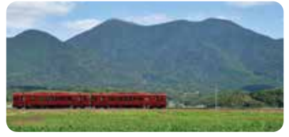
「福智山」など京築の景色も楽しみます

コースコード (①) エスコート型(C券) (②) 3840675-003 総売可 ・利用日で発券(引換不要) 重要 日程表・九州・九州から「手配書」をご記入の上、ご予約時に九州企画 仕入センターへ必ずFAXをお願いいたします。 ※代表者を含む参加者フルネーム・生年月日・代表者住所・連絡先・幼児有無入力 (①) フリーセール(発券のみ) (②) 発券 発生手配 (③) 在庫管理あり